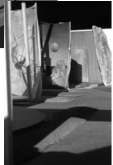
Vue subjective : l'exposition à hauteur d'œil.