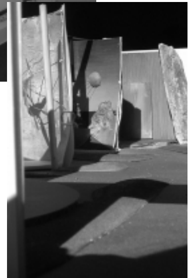
Vue subjective : l'exposition à hauteur d'œil.